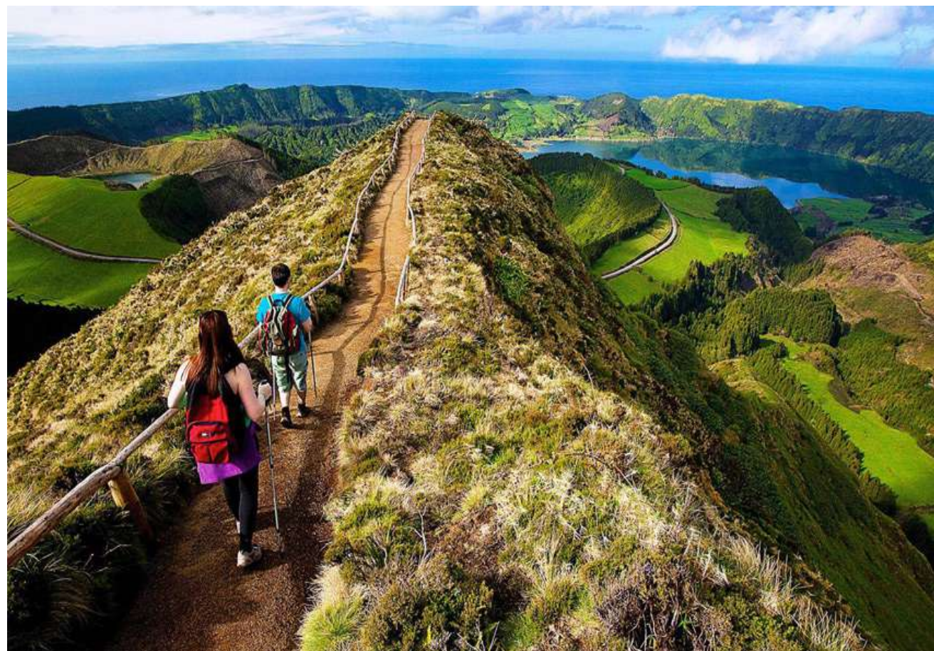
SENTIER MENANT AU POINT DE VUE DIT « BOCA DO INFERNO » (REGION DE SETE CIDADES)