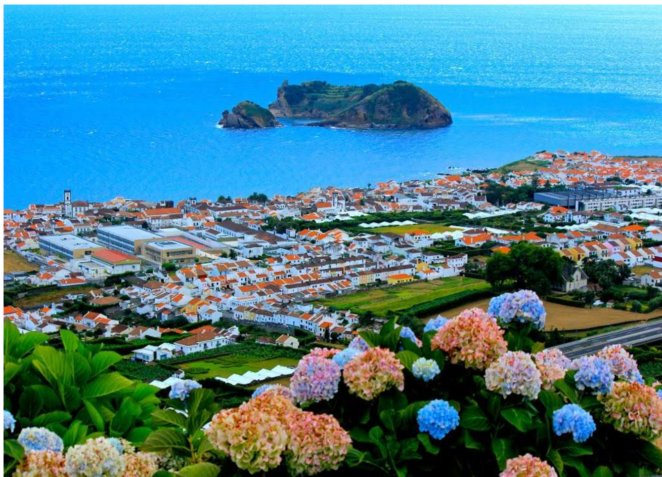
PANORAMA SUR VILA FRANCA DO CAMPO ET L'ILHEU, UN ANCIEN CRATERE SOUS-MARIN